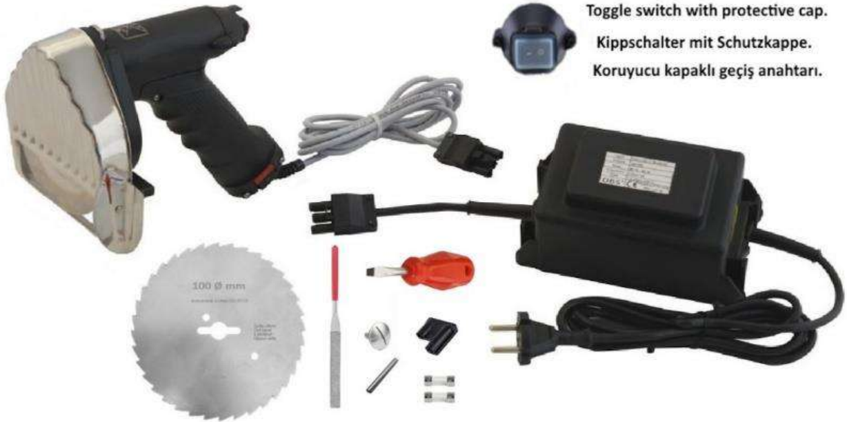
Toggle switch with protective cap. Kippschalter mit Schutzkappe. Koruyucu kapaklı geçiş anahtarı.

Bu Cihaz, Döner Salon Lari, Büfeler, Restoranlar, Ticari Mutfaklar ve diğer yerler için ideal olarak uygundur Profesyonel Catering işletmeleri.